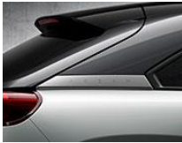
48A Ceramic + Brilliant Black + Grey*