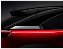
49V Soul Red Crystal + Brilliant Black*