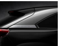
49P Jet Black + Silver