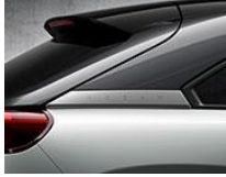
48A Ceramic + Brilliant Black + Grey