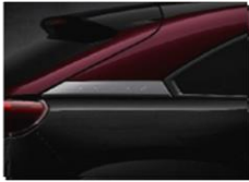
49F Ceramic + Brilliant Black + Maroon Rouge