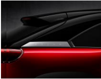
49V Soul Red Crystal + Brilliant Black