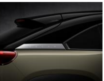
49T Zircon Sand + Brilliant Black*